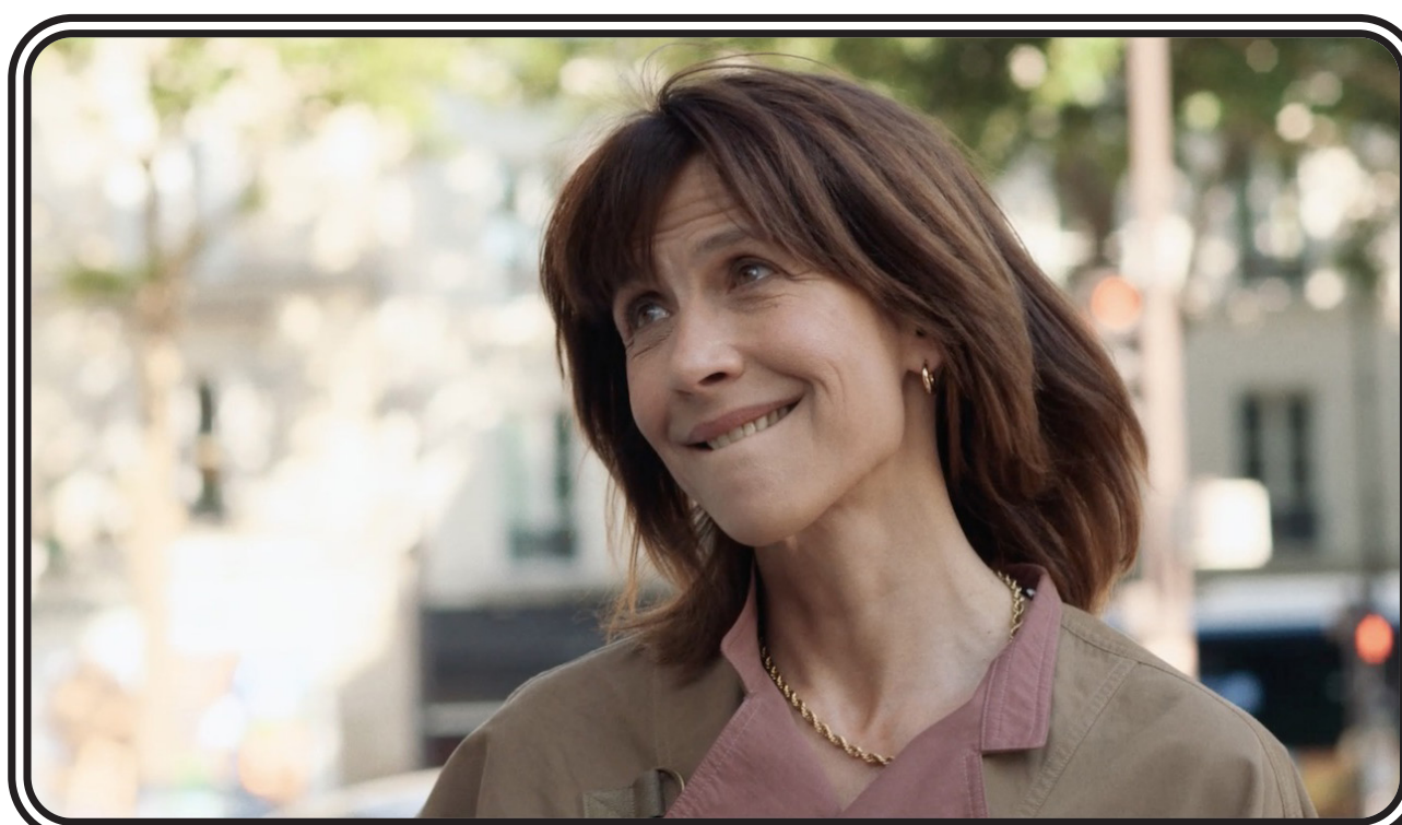
LOL 2.0 de Lisa Azuelos