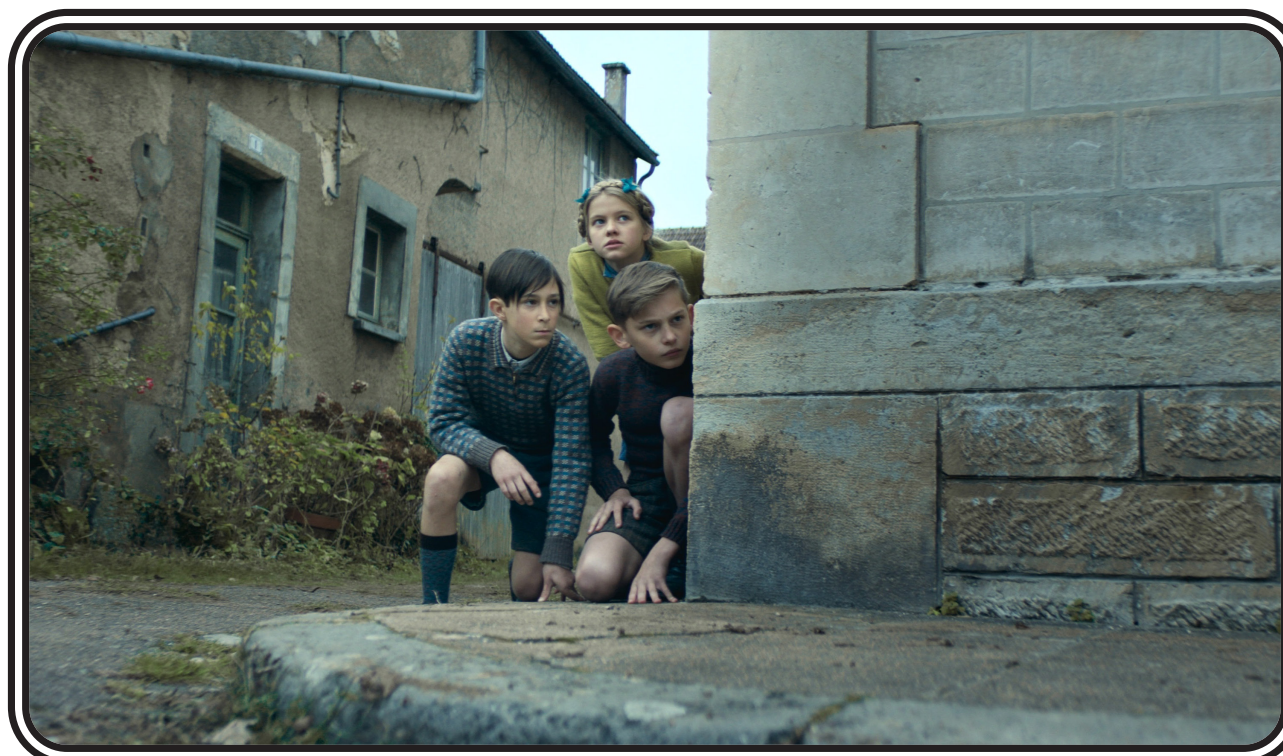
LES ENFANTS DE LA RESISTANCE de Christophe Barratier