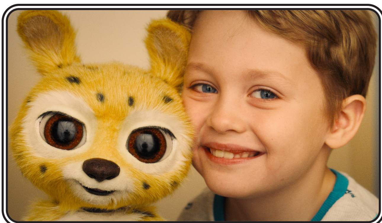
MARSUPILAMI de Philippe Lacheau