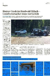
Page: 2 Surface: 35'894 mm 2