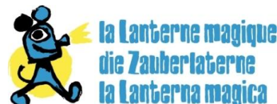
Ordre: 832010 N° de thème: 832.010 Référence: 78529370 Coupure Page: 1/2