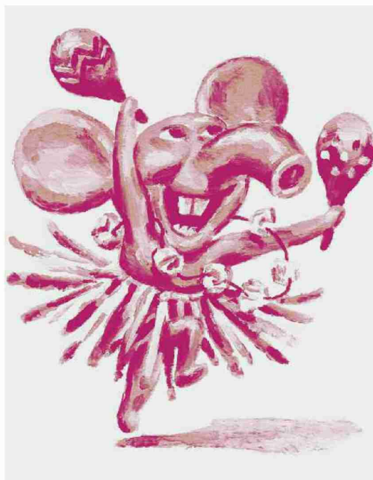
Alcune immagini per lasciare libera l'immaginazione